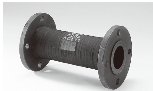
※仕様・構造等は改良のため、予告なしに変更する場合があります。