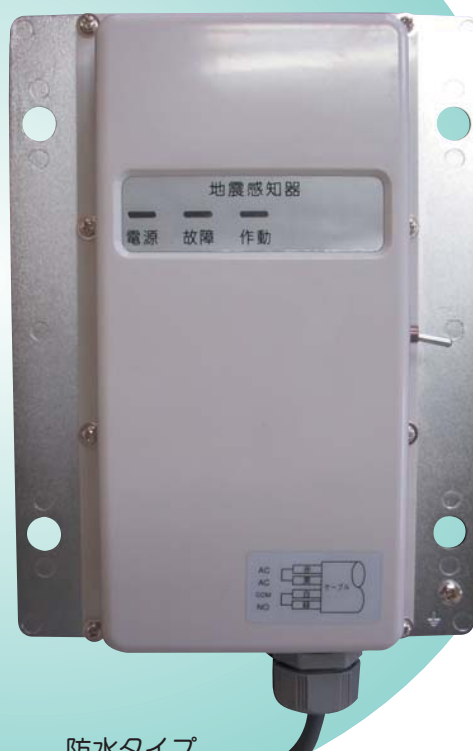
防水タイプ (Pタイプのみ)